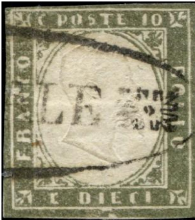
Ovale con fregi 'Acireale'