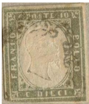
Annullò a 'Ferro di cavallo' (Sicilia)