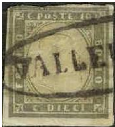
Ovale senza fregi di Vallelunga