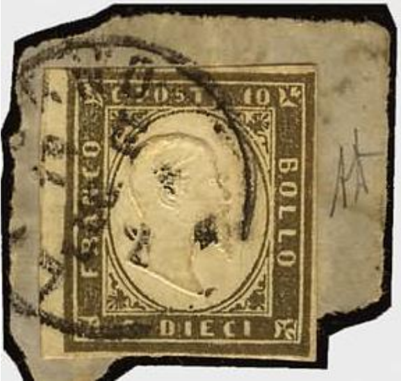
Prevalenza di grigio

Questa tinta, estremamente scura, parte dalla nuance con prevalenza di grigio per arrivare, attraverso le varie nuance, a quella con prevalenza di oliva