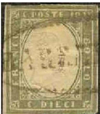
Ovale senza fregi di Barrafranca