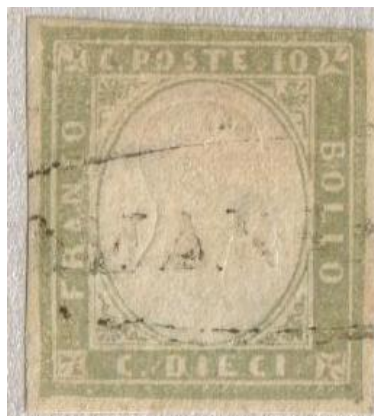
Ovale con fregi di Marsala